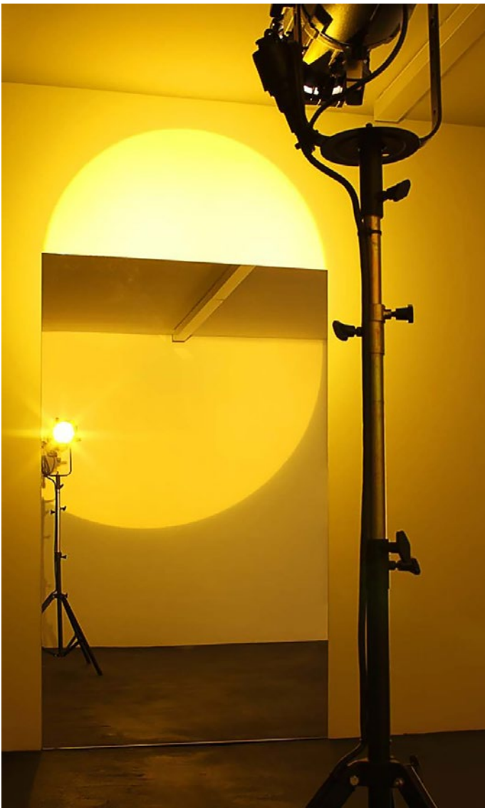
Olafur Eliasson, Yellow Door Semicircle, 2008 , Erling Kagge Collection

So wie wir sind 1.0 markiert eine konzeptuelle Neuaufstellung der Weserburg Museum für moderne Kunst und gründet gleichzeitig auf das, was die Struktur und Arbeit des Hauses als Europas erstes Sammlermuseum wesentlich ausmacht: Die enge Partnerschaft mit Privat- und Unternehmenssammlungen.